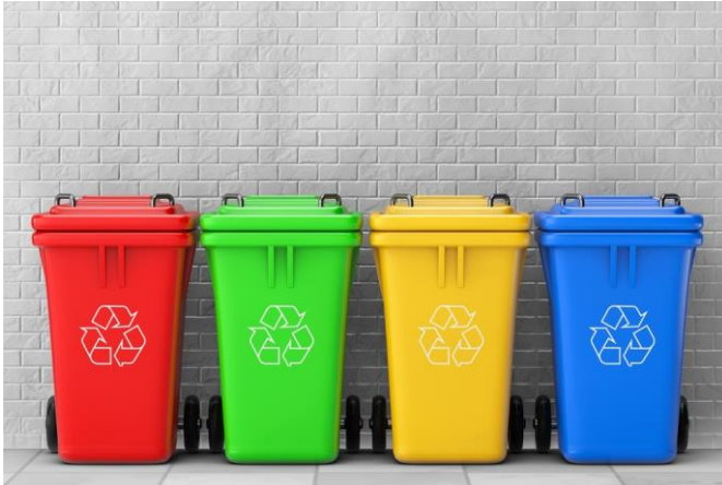
מתקן עירוני לטיפול בפסולת