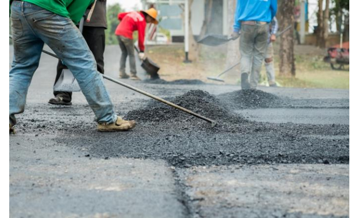
שיקום ותחזוקת כבישים עירוניים