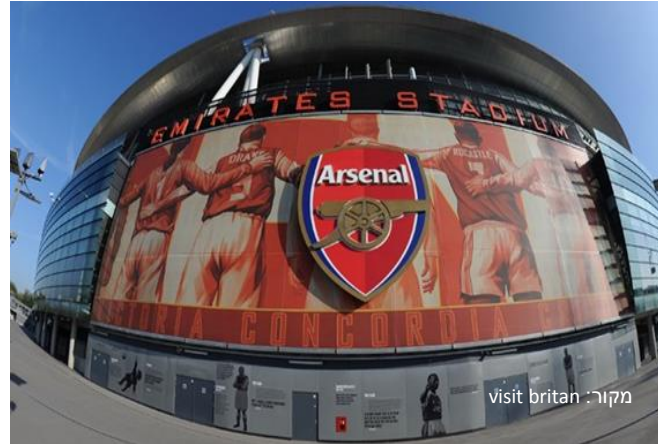
אצטדיון כדורגל עירוני