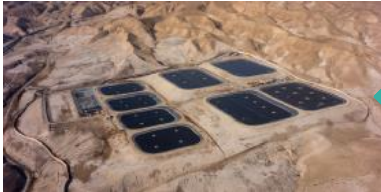
מט"ש נבי מוסא